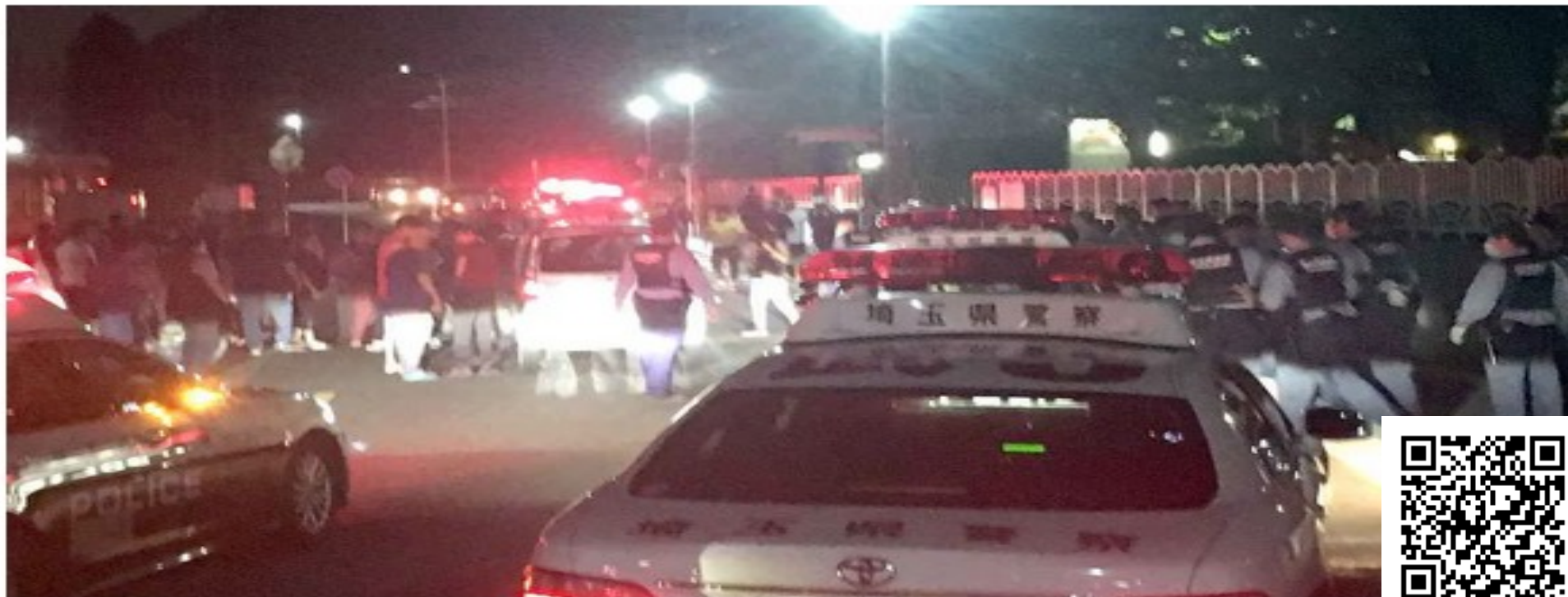
クルド人らによる騒ぎがあった現場＝7月4日夜、埼玉県川口市の市立医療センター前

社会 | 事件・疑惑 | 写真・動画 | 動画 | 地方 | 関東 | 埼玉 | 移民問題